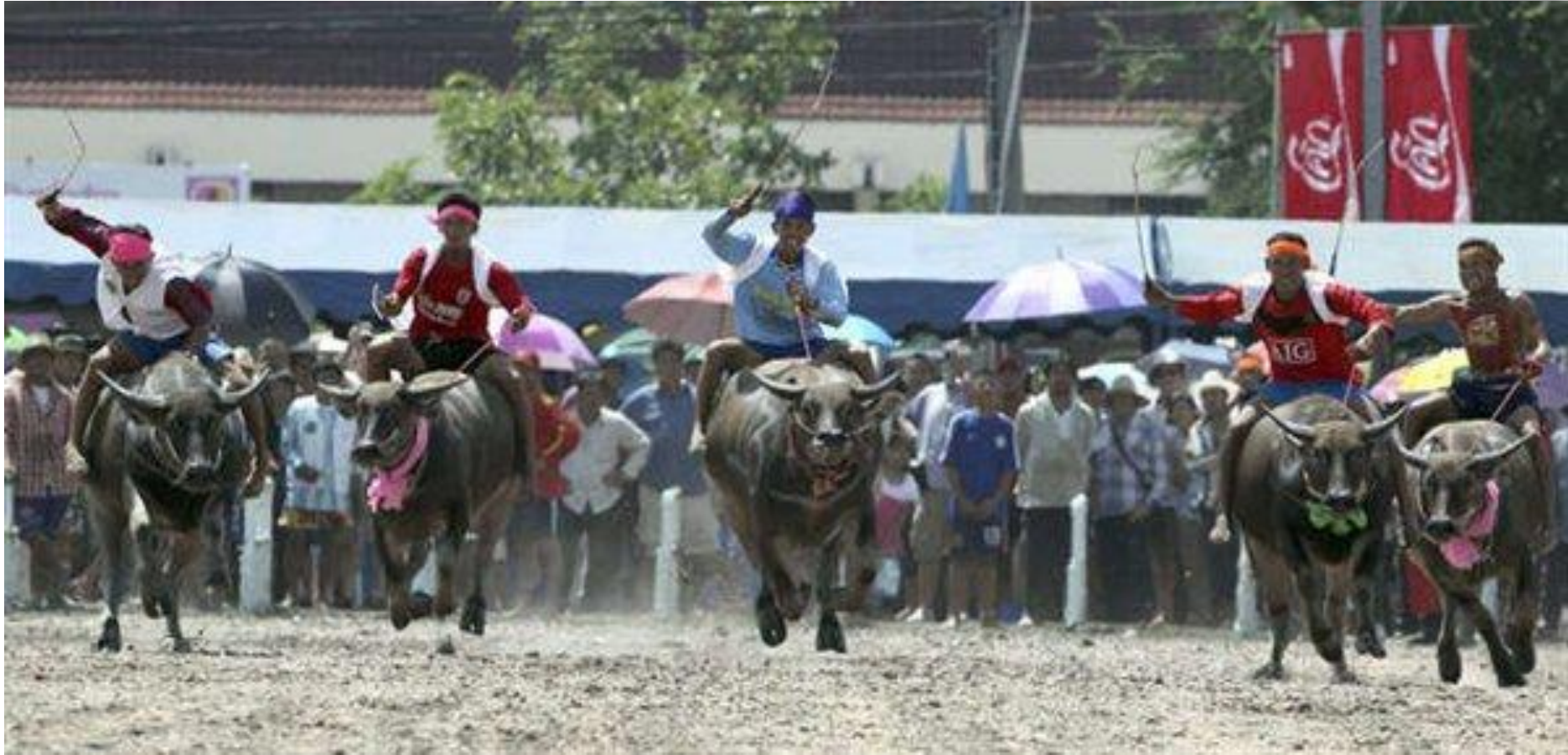
Carreras de búfalos de agua en Chonburi (Tailandia) Agricultores tailandeses compiten en una carrera a lomos de búfalos de agua